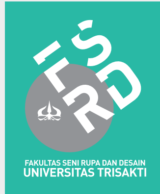
Background warna Toska