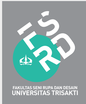
Background warna Abu-Abu

Hanya pilihan warna tersebut yang dapat digunakan. Unduhlah melalui www.fsrд.trisakti.ac.id