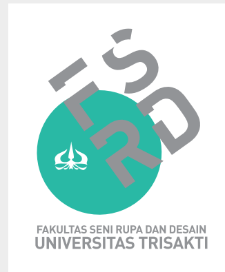
Background warna Putih